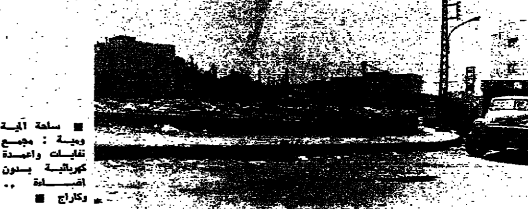
المية ومية - من تزيمه تقوزي

«المية ومية» قرية «موية» قرية اخرى من قرى صيدا يقطنها الاهالي. صحيح ان طرفاتها قد رقتت مؤخراً، الا ان هذا الترتيب، كان كما يقول الاهالي «ترقيماً» على الماشي، فلم يمس وقت قصير حتى زال الزيم. الشكوى من نقاد النظافة في «المية ومية» رغم تصامها لا تفي تراوح مكانها، ولا تجد من يعمل على معالجتها. ورغم صدور قرار يتكلم باموال جمع النقابات الى عمل جديد، فلم يطرأ اي تحسين. اصحبه بلا مصابيح البلدية للاضاءة قسماً في اية ومية.. اعمدة الكهرباء منسوبة على جانب الطريق لتوصي للمارة ان التيار الكهربائي موجود فقط، اما الاشارة فلها محرومة جهاد ذلك لعدم وجود ايات على تلك الاعمدة. المياه قسمتها قصة أما المياه فإن لها قصة ايضا مع اهالي «المية ومية»، نظراً لتكوين شبكة المياه عمدة لمعهد الشراك، وتكون المياه في «المية ومية» كغيرها من القرى المجاورة، عمدة منسوبة مياه نبع الطاسة، وهذا يعني لتعرف قضية المياه. ويقول الاهالي انهم منذ اكثر من ستة اشهر يراجون المسؤولين في مصلحة مياه نبع الطاسة، ولم يهتموا بشأن احد الكسامل في رسة الشراخ الرئيسي، وهم بحاجة الى اصلاح نظراً لتسرب المياه منه، مما يؤدي الى اخطا الطريق الضم، وعلى رغم ذلك، فان احدى المصلحة لم يتحرك لاجراء اصلاحات اللازمة، ورغم الوجود التي يتطوفا في كل مرة. ويتسائل الاهالي اخيراً عندها يجيبه عليه لفتت نظر المسؤولين عن تصليحها ويتنون في عهد ائمان الجديد، ان تسلمهم حقوقهم كغيرهم، من قرى المناطق الاخرى. كما يظنون ان يشرفهم قرار وزير الداخلية بتفليح لجنة بلدية لمية ومية لتتولى معالجة قضايا البلدة.